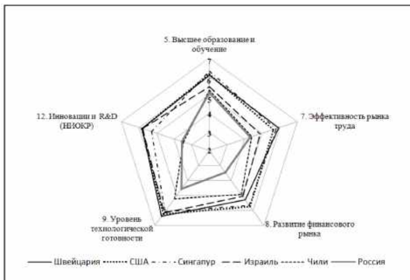
Рис. 1. Диаграммы показателей ключевых субиндексов GCI 2017-2018, вошедших в UDI/c, для стран первых четырёх лидирующих регионов, США и России

Более полную картину позиционирования России в отношении возможности создания университета 3.0 дает таблица 2, в которой приведены значения индекса предпосылок развития UDI, вспомогательных индексов UDI/c и UDI/p для стран-лидеров семи мировых регионов.